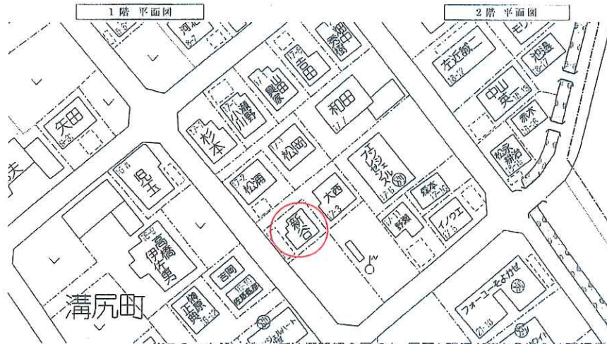
※このハウジングマップは概略紹介図です。図面と現況が異なる場合は現況優先となります。