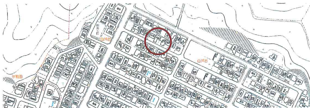
※このハウジングマップは概略紹介図です。図面と現況が異なる場合は現況優先となります。